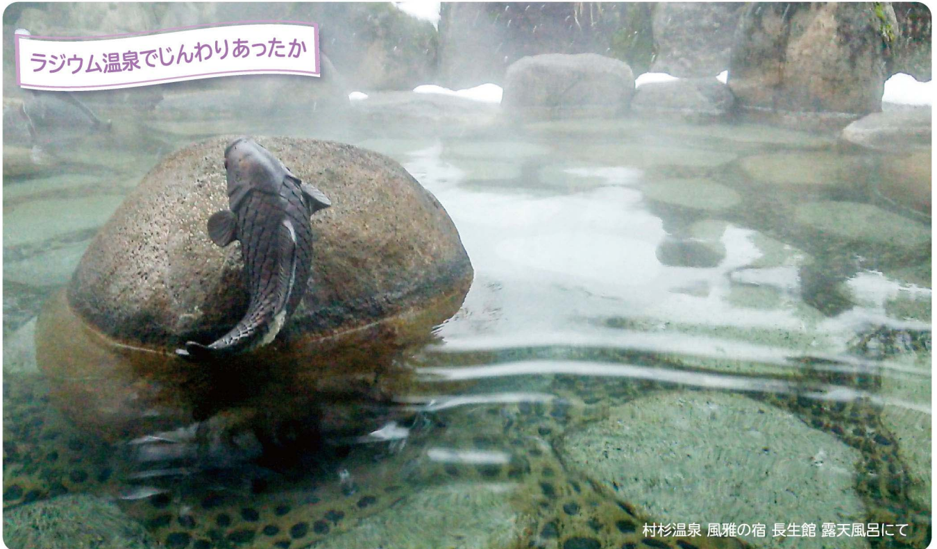
ラジウム温泉でじんわりあったか