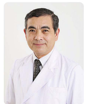
脳神経センター阿賀野病院

今後も皆様方の期待に応えられるよう努力して参りますので、これまでと変わらぬご支援を賜りますようお願い申し上げます。