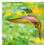
ハチドリ(ハミングバード)の頭の形と似ているために名付けられました。ハチドリは日本にはいないようですので、郊外で見たことありません。

現在の一番の問題は、やはりパーキンソン病のように、効果が期待できるような薬が少ないことです。今後新たな薬が開発されることが期待されています。